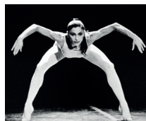
Le sacre M. Béjart © Dominique Genevois